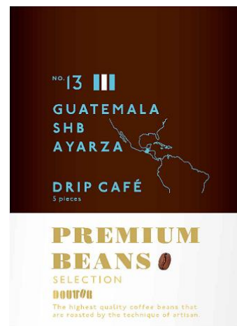
ドリップカフェ5袋入り