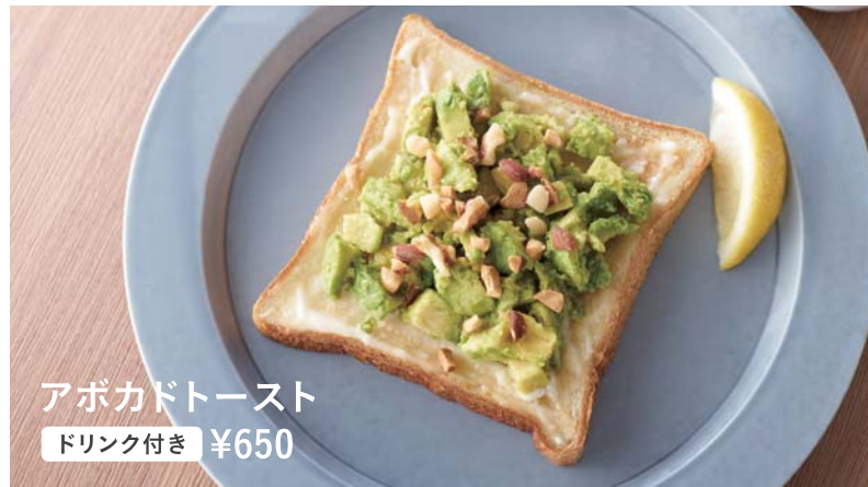
アボカドトースト ドリンク付き ¥650