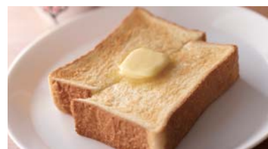
バタートースト ¥550 ドリンク付き