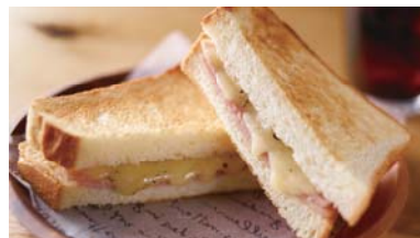
ハムチーズトースト ¥650 ドリンク付き