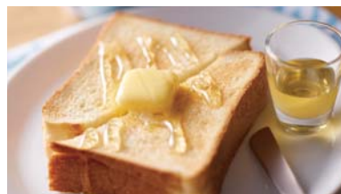
ハニーバタートースト ¥600 ～イタリア産有機はちみつ～ ドリンク付き