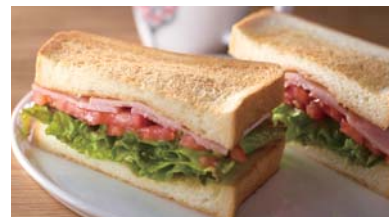
HLTサンド ¥700 ドリンク付き