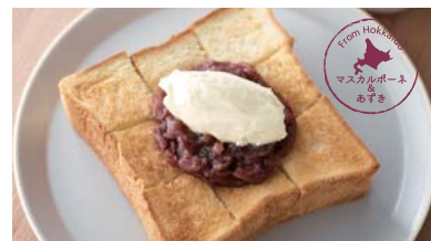
あんマスカルポーネトースト ¥650 ドリンク付き