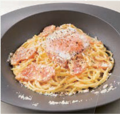
半熟卵と燻しベーコンの カルボナーラ ¥990