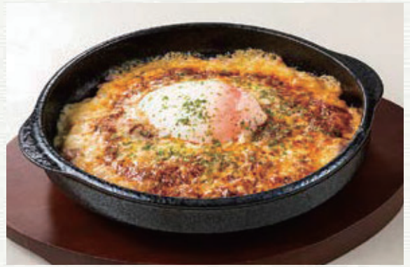
半熟卵のボロネーゼドリア ¥830