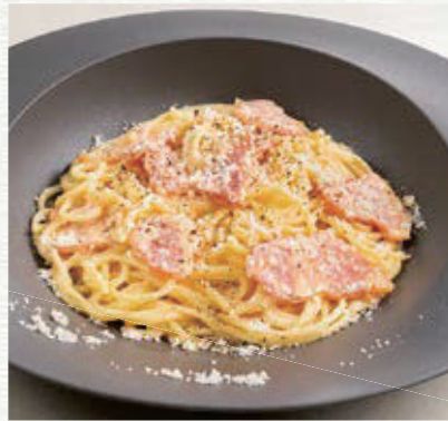
燻しベーコンの カルボナーラ ¥890