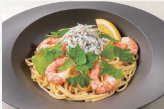
海老としらすのたらこパスタ ¥890