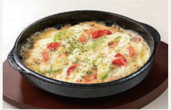
海老とアボカドのチーズドリア ¥830